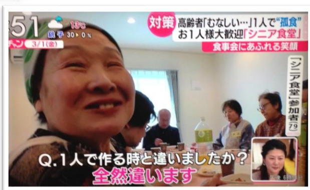
↑TBS「あさちゃん!」で紹介されました (2019年3月1日)