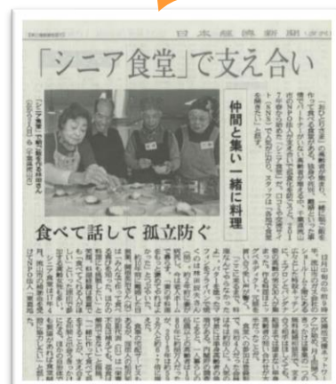
↑日経新聞で紹介されました (2018年12月28日)