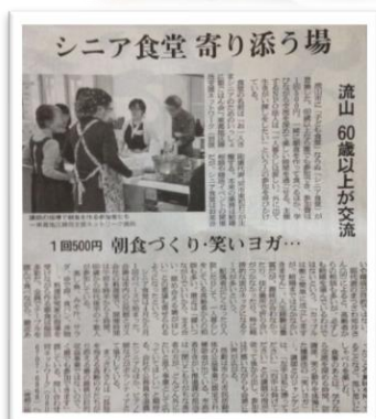
↑朝日新聞で紹介されました (2017年7月5日)